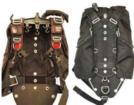
Nomad Side Mount System в сборе